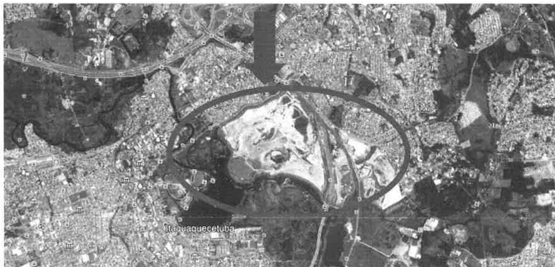
Imagem do Google Earth com a indicação da área do “Porto 1”, esclarecendo não se tratar o local de “hidrografia” (recurso hídrico)

Anexo à Contribuição ao Caderno Preliminar de Propostas de autoria da Itaquareia Indústria Extrativa de Minérios Ltda.