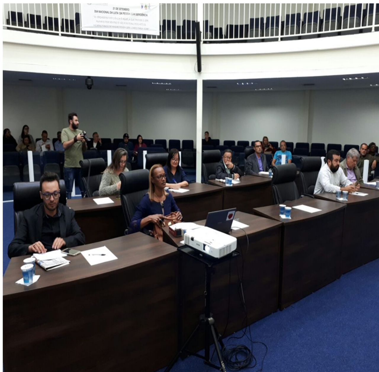
VARGEM GRANDE PAULISTA