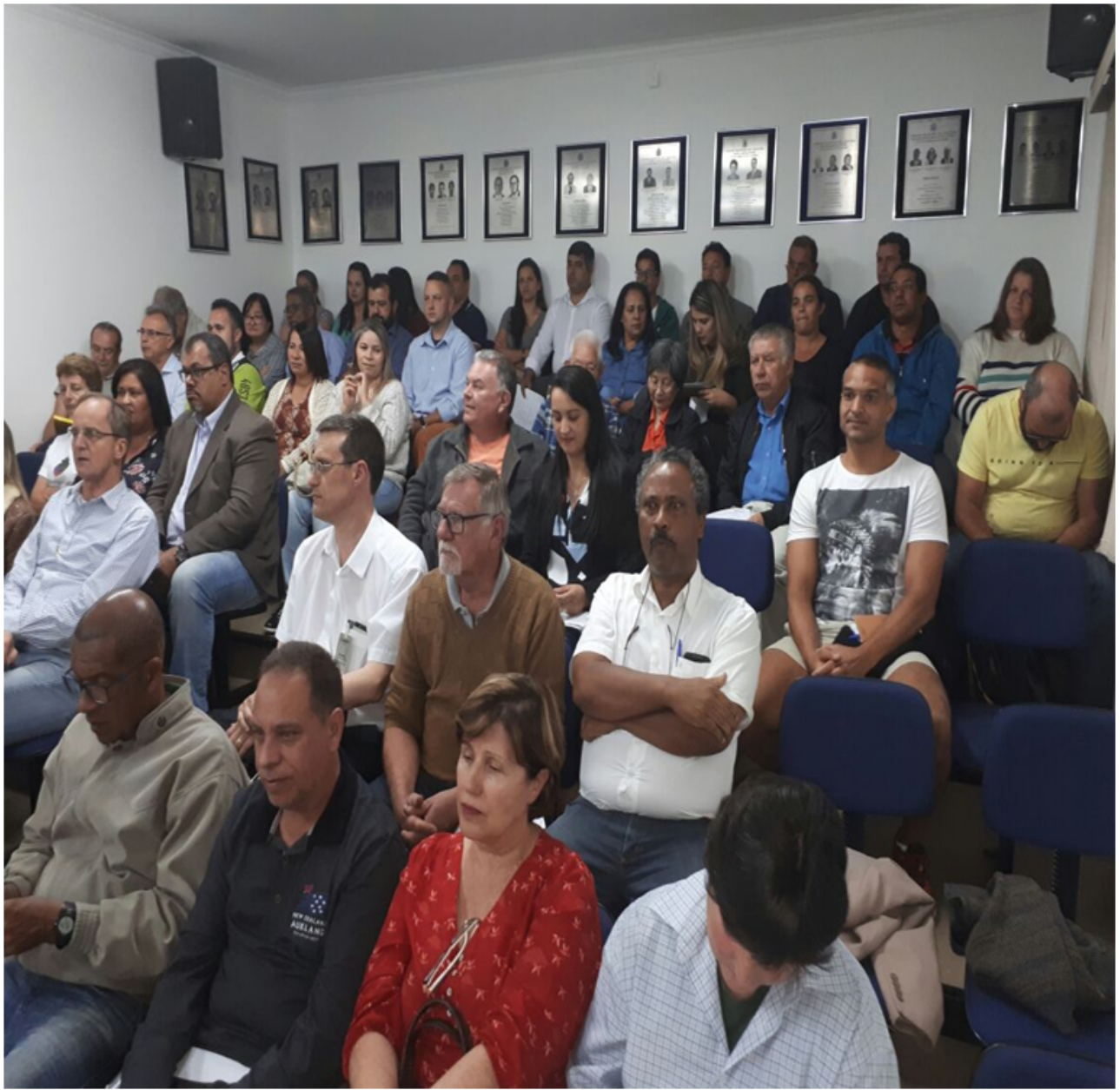
TABOÃO DA SERRA