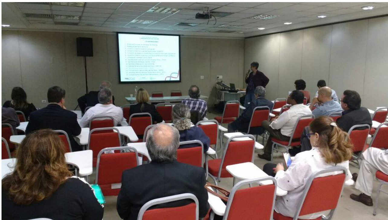
( https://www.pdui.sp.gov.br/rmsp/wp-content/uploads/2017/07/8-1.jpg )