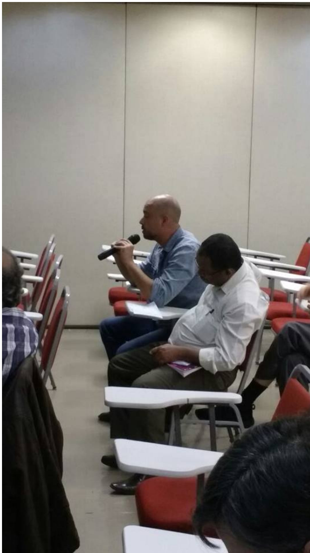
( https://www.pdui.sp.gov.br/rmsp/wp-content/uploads/2017/07/10-1.jpg )