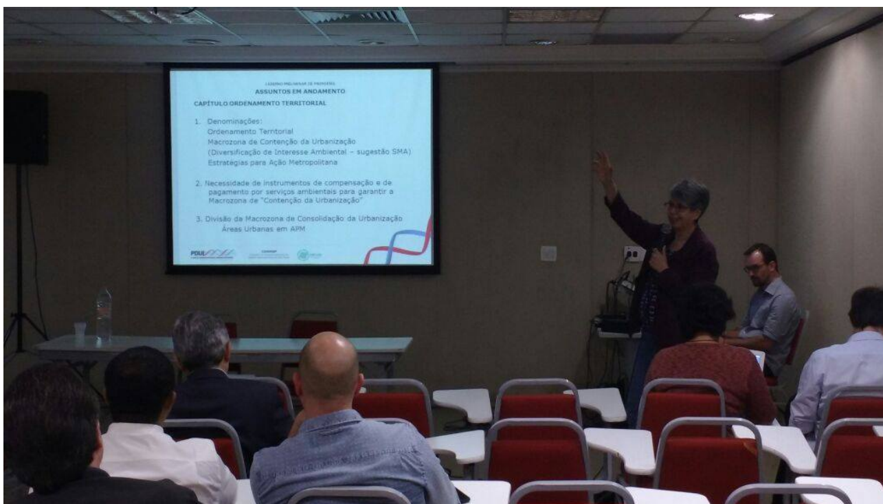
( https://www.pdui.sp.gov.br/rmsp/wp-content/uploads/2017/07/9-1.jpg )