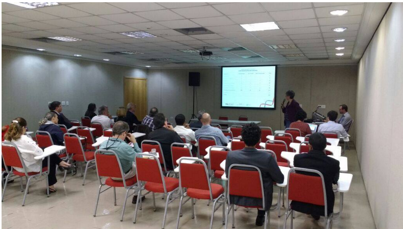
( https://www.pdui.sp.gov.br/rmsp/wp-content/uploads/2017/07/1-1.jpg )